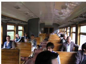
郊外列車車内風景

ピロビジャン市へはシベリア鉄道の郊外列車や、バスを利用して日帰り旅行が可能です。ユダヤ人の習慣や生活様式や文化を味わうことができます。