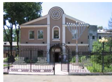
ユダヤ人の文化を伝える博物館