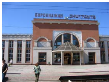
ピロビジャン駅舎