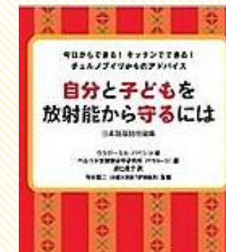
※研究所発行の書籍

90年に非国立系の研究所として西欧からの支援を受け設立。研究テーマは土壌・水質汚染の測定、食品の測定、人体の測定～その後2000年からは測定と平行してペクチン剤であるビタペクトを開発・製造・販売し、ボランティア団体も購入し、チェルノブイリの子どもに配布しています。各国の団体から支援を受けています。現在、マイクロバスにホールボディカウンタを載せて汚染地域の学校へ測定巡回を行っています。