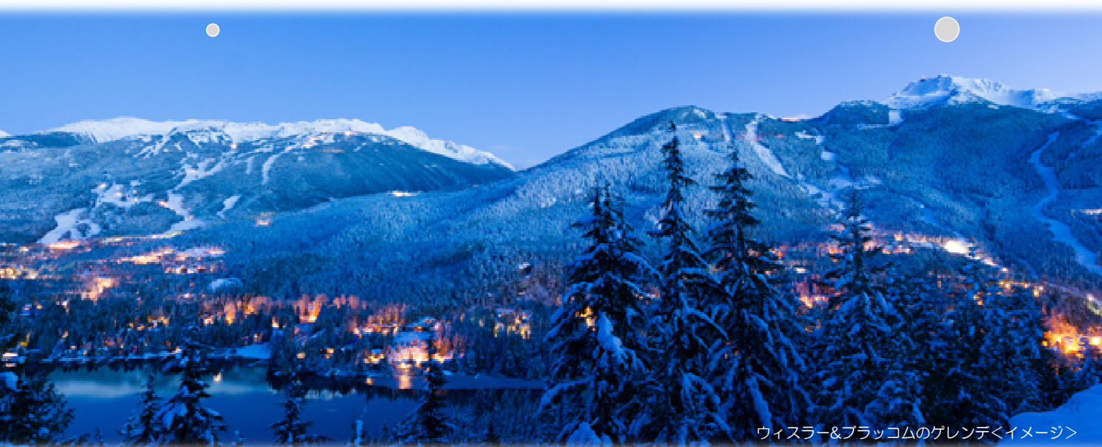
ウィスラー&ブラッコムのゲレンデ<イメージ>