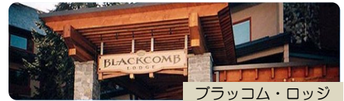
ブラッコム・ロッジ