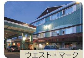
ウエスト・マーク