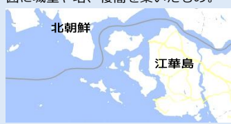
▶江華島 ソウル北西に位置する島。紀元前から人が住んでいた痕跡があり、世界遺産に登録された支石墓は壇君王様が初めて降臨した地とされている。李氏朝鮮時代の謀反王族等の流刑地であり、侵略の第一歩の場所。