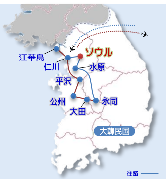
世界遺産と江華島

●利用予定航空会社：アジアナ航空/大韓航空 ●宿泊予定ホテル：ソウル(ニュー国際、ニューソウル、慶南観光ホテルあるいはヘニキアホテル) 注：日程中のマーク：●印＝入場見学、◎印＝下車見学、○印＝車窓見学、☒＝食事付、☒＝自由食、☒＝機内食 《朝食4回・昼食3回・夕食4回、機内食別》