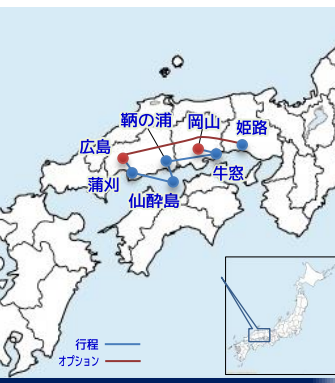
通信使が訪れた地

●宿泊予定ホテル：鞆の浦(鞆の浦サイドホテル)、呉市(呉阪急ホテル)、姫路(姫路キャッスルグランピリオ) 注：日程中のマーク：●印＝入場見学、◎印＝下車見学、○印＝車窓見学、OP＝参加者希望のオプション・ツアー、☒＝食事付、☒＝自由食、☒＝機内食、《朝食4回・昼食3回・夕食4回、機内食別》