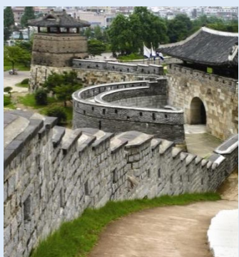
▶水原華城 世界遺産 李氏朝鮮時代の城塞遺跡。時の国王が子の墓を水原の顕隆園に移して周囲に城壁や塔、樓閣を築いたもの。