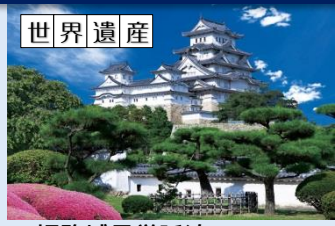
●姫路城見学延泊ツアー 5名以上：31,800円 10名以上：23,200円 15名以上：20,300円 ※2人1部屋料金