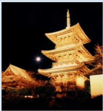
▶本蓮寺 使節団がはじめて宿泊した古刹。三重塔は海岸に映える全国唯一の塔。番神堂(三祠)は全国に3箇所しかない重文指定遺産