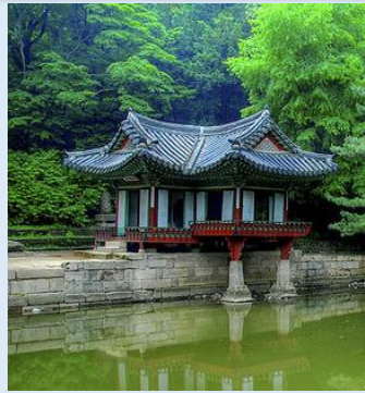
▶昌徳宮 世界遺産 14世紀～20世紀まで続いて朝鮮王朝を現在に伝える古宮。韓国5大古宮の中で唯一世界遺産に選定。