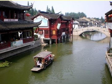
▶ 七宝古镇（上海） 上海市内西部に位置し、江南太湖流域の千年古镇の1つ。河にかかるいくつもの橋、美しい自然景色と悠久の歴史・文化が見事に融合した明清時代の古い街並みが続く。