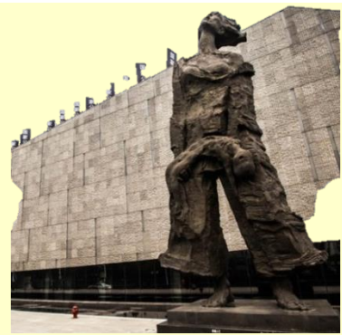
▶ 侵華日軍南京大虐殺遭難同胞記念館 1983年設立。日本における中国侵略と1937年日本軍により地元民が大量虐殺された歴史・文献を展示。