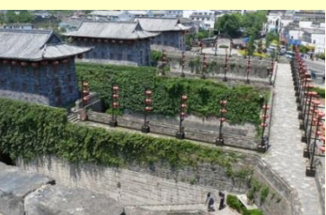
▶ 中華門（南京） 遠く六朝の時代から繁華街として栄えた夫子廟の南に位置する門。周囲33.6㊤の南京城牆の一部であり南京城最大の城門。南京攻防戦の激戦地でもあった場所。