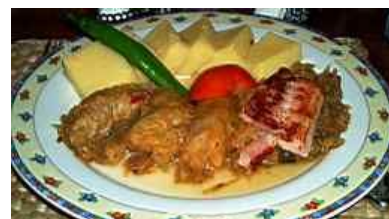
ルーマニア料理《サルマーレ》

旅行企画・実施:株式会社ユーラスツアーズ 観光庁長官登録旅行業第49号 JATA 正会員