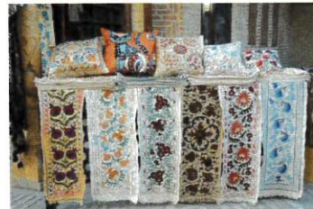
ウズベキスタン刺繍模様