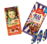
お土産にぴったりな かわいなお菓子